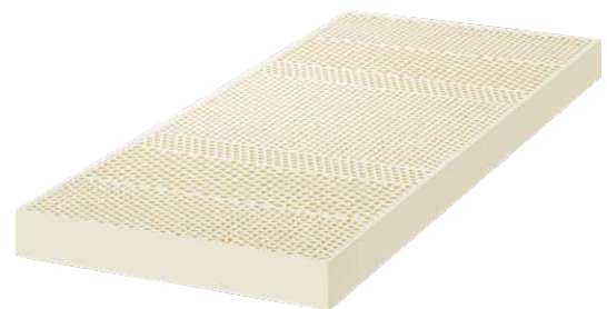
Matratze Honey 13cm