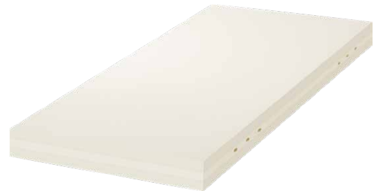
Matratze 2-Flex 13cm