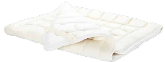
Auflage Schafschurwolle Solo oder Duo