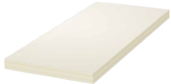
Matratze 2-Flex 10cm